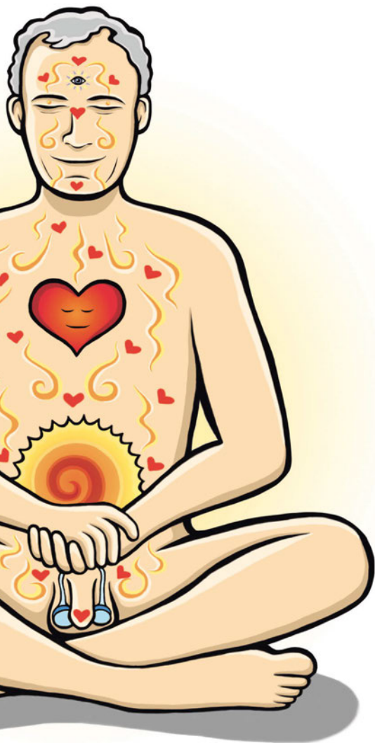
bild av sin sexualitet. Jag tänker på bilden av mannens sexualitet som okontrollerbar, djurisk, ibland med våldtäkter och övergrepp som följd. De flesta män känner ju inte igen sig i den bilden, men upplever sig ändå drabbade, bara för att de är män.

- Män säger också att de är trötta på att sexlivet är deras ansvar - det är bådas ansvar! Och både män och kvinnor borde skipa kraven och stiga in i närvaro i ett fritt flöde utan värderingar där man öppnar upp för den sexuella kraften och avslappning i kroppen. Då tror jag att vi skulle skapa helt andra relationer.